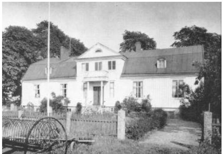
Leissnergårdens mangårdsbyggnad i Torarp.